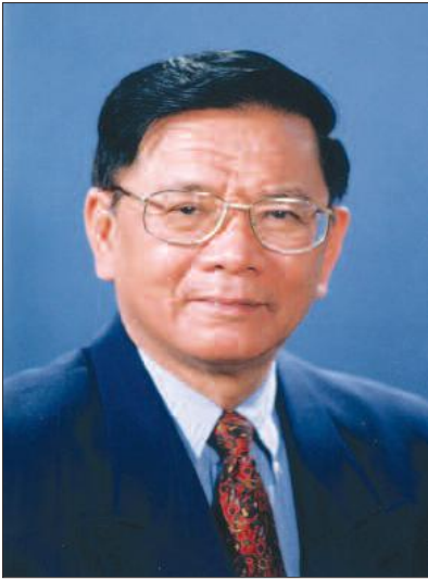
Nguyễn Dy Niên Bộ trưởng Bộ Ngoại giao nước Cộng hòa xã hội chủ nghĩa Việt Nam (2-2000 – 6-2006)