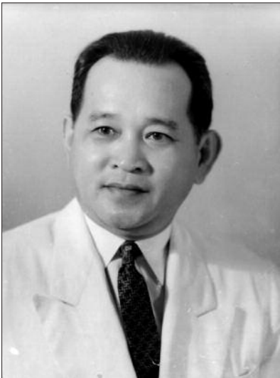
Ung Văn Khiêm Bộ trưởng Bộ Ngoại giao nước Việt Nam Dân chủ Cộng hòa (2-1961 – 4-1963)