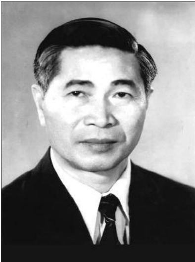
Nguyễn Cơ Thạch Phó Chủ tịch Hội đồng Bộ trưởng, Bộ trưởng Bộ Ngoại giao nước Cộng hòa xã hội chủ nghĩa Việt Nam (2-1980 – 7-1991)