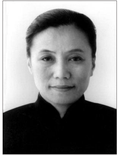
Nguyễn Thị Bình Bộ trưởng Bộ Ngoại giao Chính phủ Cách mạng lâm thời Cộng hòa miền Nam Việt Nam (6-1969 – 7-1976)