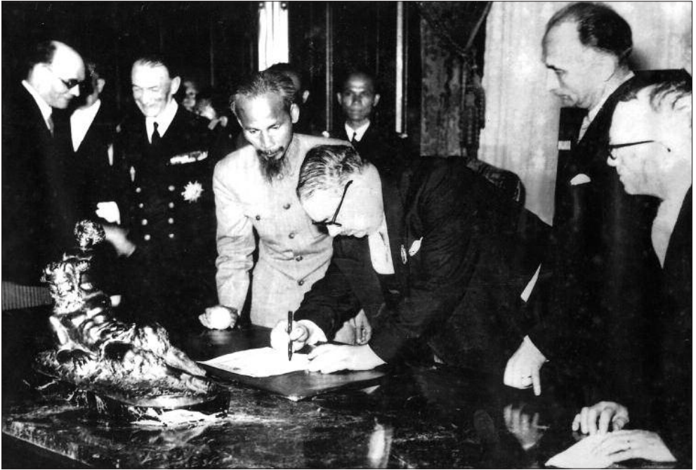
Chủ tịch Hồ Chí Minh ký Tạm ước ngày 14 tháng 9 tại Pari (14-9-1946)