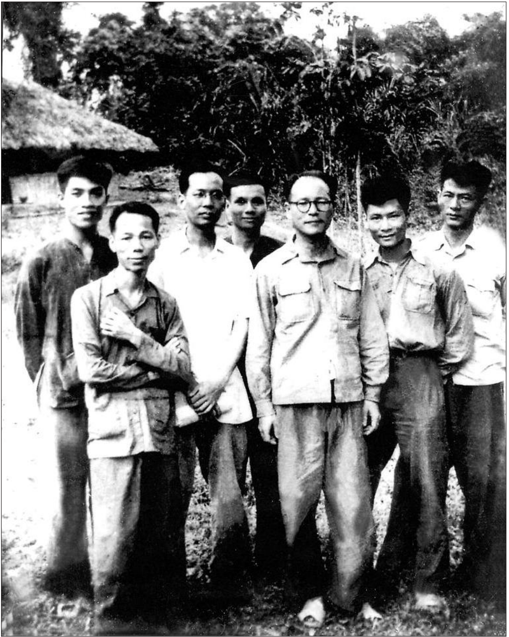
Bộ trưởng Bộ Ngoại giao Hoàng Minh Giám cùng cán bộ của Bộ Ngoại giao tại ATK Việt Bắc (1947)