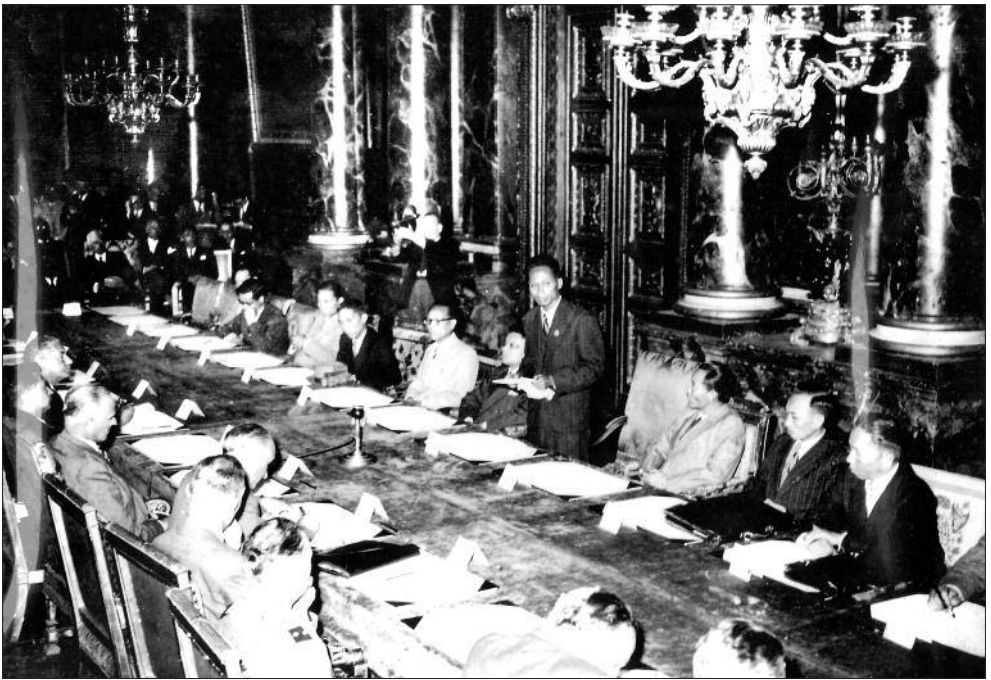
Trưởng phái đoàn Chính phủ nước Việt Nam Dân chủ Cộng hòa Phạm Văn Đồng phát biểu ý kiến tại Hội nghị Phôngtennoblô (1946)