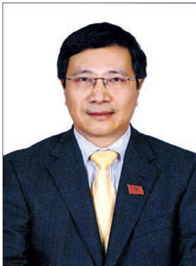
Phạm Bình Minh Phó Thủ tướng, Bộ trưởng Bộ Ngoại giao nước Cộng hòa xã hội chủ nghĩa Việt Nam (8-2011 đến nay)