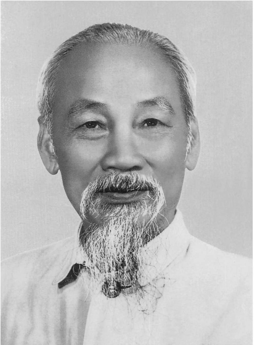
Chủ tịch Hồ Chí Minh Bộ trưởng Bộ Ngoại giao nước Việt Nam Dân chủ Cộng hòa (28-8-1945 – 2-3-1946; 3-11-1946 – 3-1947)