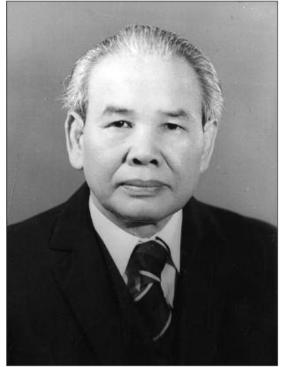
Xuân Thủy Bộ trưởng Bộ Ngoại giao nước Việt Nam Dân chủ Cộng hòa (4-1963 – 4-1965)