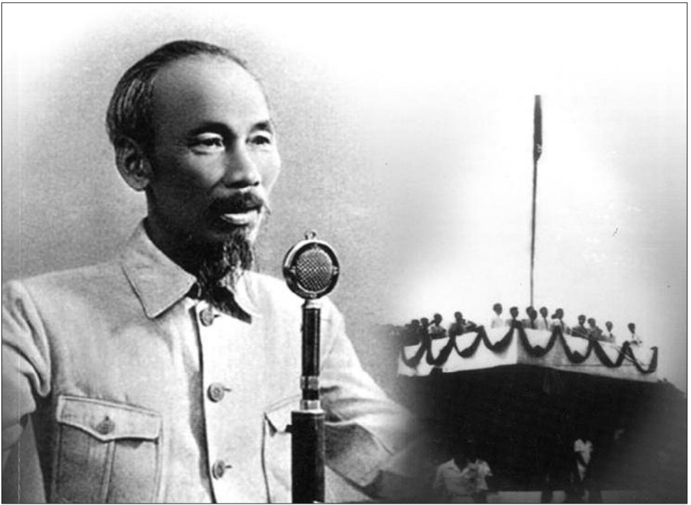
Chủ tịch Hồ Chí Minh đọc bản Tuyên ngôn độc lập (2-9-1945)