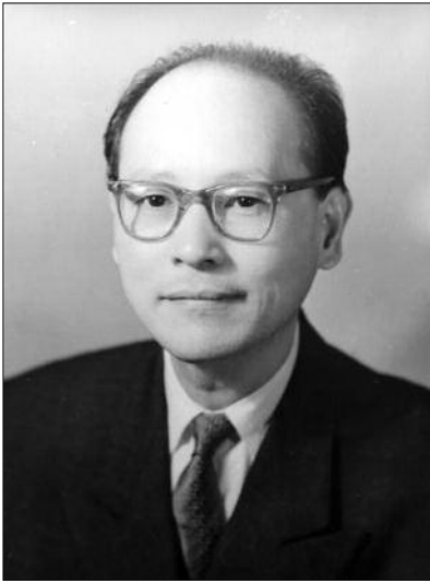
Hoàng Minh Giám Bộ trưởng Bộ Ngoại giao nước Việt Nam Dân chủ Cộng hòa (3-1947 – 9-1954)