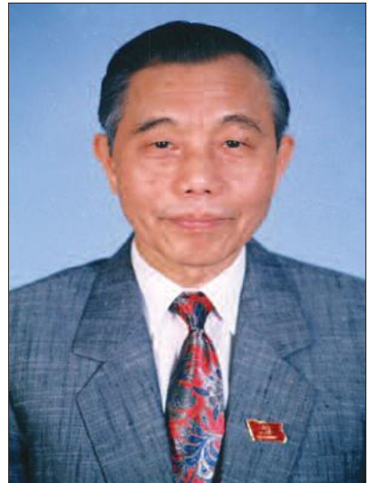
Nguyễn Mạnh Cầm Phó Thủ tướng, Bộ trưởng Bộ Ngoại giao nước Cộng hòa xã hội chủ nghĩa Việt Nam (8-1991 – 2-2000)