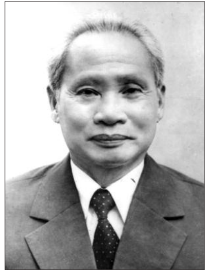
Phạm Văn Đồng Thủ tướng, Bộ trưởng Bộ Ngoại giao nước Việt Nam Dân chủ Cộng hòa (9-1954 – 1-1961)