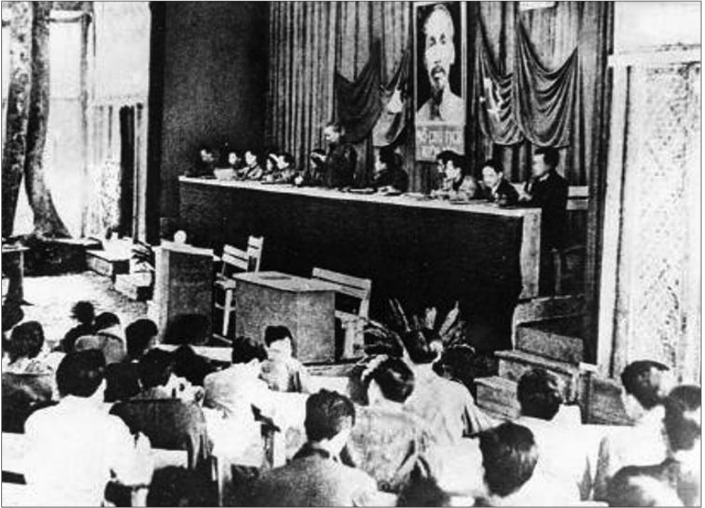
Quang cảnh Đại hội lần thứ II của Đảng Lao động Việt Nam tại Việt Bắc (3-1951)