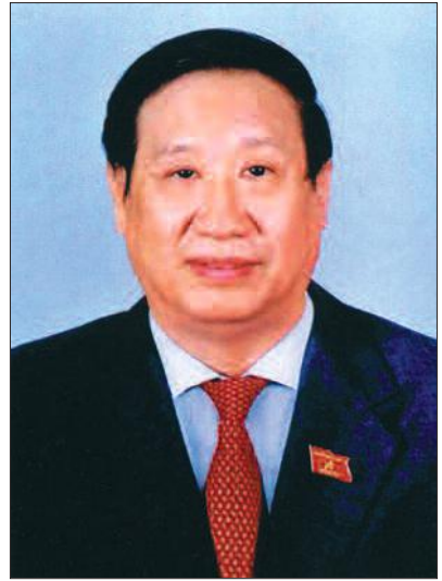
Phạm Gia Khiêm Phó Thủ tướng, Bộ trưởng Bộ Ngoại giao nước Cộng hòa xã hội chủ nghĩa Việt Nam (7-2006 – 8-2011)