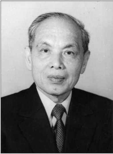
Nguyễn Duy Trinh Phó Thủ tướng, Bộ trưởng Bộ Ngoại giao nước Việt Nam Dân chủ Cộng hòa và nước Cộng hòa xã hội chủ nghĩa Việt Nam (4-1965 – 2-1980)